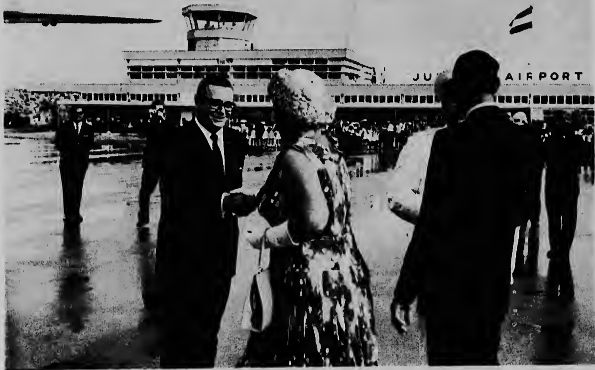
Minister President E. Jonckheer aki ta tuma despedida di S.M. Reina Juliana promer qu e soberana huntu cu Prins Bernhard a drenta den e avion qu a hibebe Puerto Rico pa continua e viahe pa Surinam.